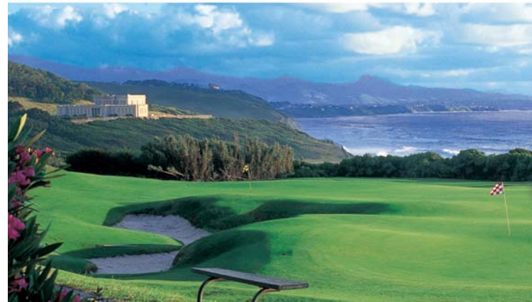
Centre International d'Entraînement d'Ibarriz (stade d'approches)